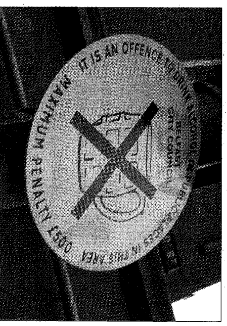
Alkoholin juominen kadulla kielletty – sakko on kova.

Ikäihmiset ovat aktiivisia vaikuttajia. Pohjois-Itämeressä käydään nyt kovaa kamppailua ikäihmisten hyvinvoinnin puolesta. Talouden ylikorostumisesta arvostellaan ja sosiaalisiin kysymyksiin halutaan lisätä huomiota. Viime joulukuussa Belfastissa järjestettiin ikäihmisille parempia elämisen ehtoja. Huolenaiheina olivat kohonneet elinkustannukset. Monet vanhukset joutuivat talvella vaihtamaan, ostavatko ruokaa vai lämmityshiliiä – molempiin